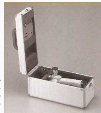
Maleta de alumínio tipo case (acessório incluso)