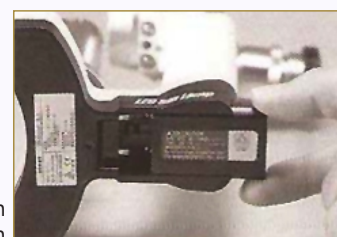
Bateria Li-on 7.4V 680mAh