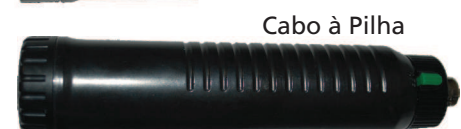
Cabo à Pilha